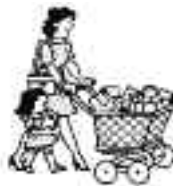
Hacer la compra