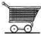
Coger el carrito

Horario Comprobarás que una agenda visual con los diferentes pasos de la salida de compras incrementará la comprensión de tu hijo sobre lo que está pasando. A algunos niños les irá mejor con una enumeración de todos los pasos detallados, en cambio otros necesitarán sólo uno o dos pasos en la secuencia.